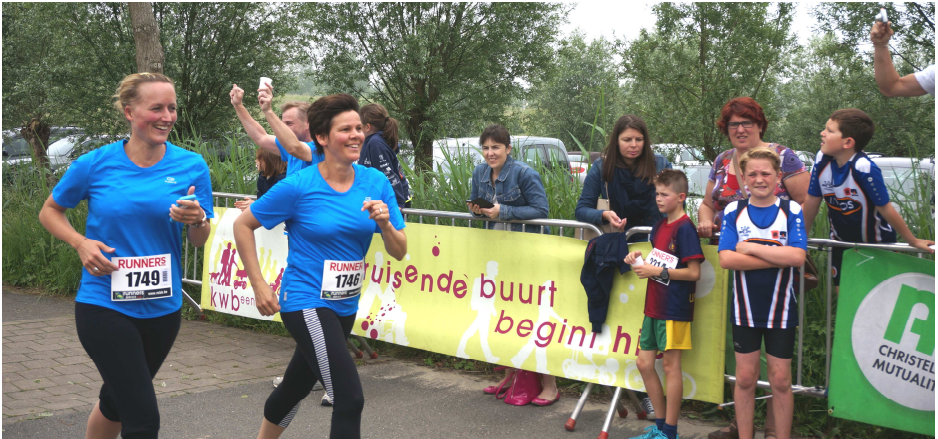
"Beginnende" joggers van KWB Rupelmonde met de glimlach over de meet na hun examen.